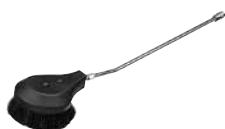
Spazzola rotante (max 60°C)