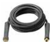
Kit prolunga tubo gomma mandata