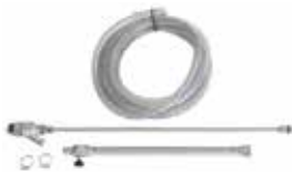
Kit lancia sabbicante/bicarbonato professionale