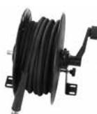
Avvolgitubo con tubo gomma